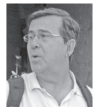
■ Του ΧΑΡΗ ΣΤΡΑΤΙΔΑΚΗ

Είναι μεγάλη προσφορά του Κυνηγιού του Θησαυρού στη γνώση της ιστορίας (πολιτικής, κοινωνικής, οικονομικής φυσικής κ.λπ.) ενός τόπου, για μικρούς και μεγάλους. Δεν θα επιχειρηματολογήσουμε σήμερα γι' αυτό, αφού το έχουμε κάνει ήδη πριν από μια εικοσιπενταετία, στον πάντα φιλόξενο-ρεθεμνιώτικο Τύπο. Η διαχρονική ανταπόκριση του κοινού στα κάθε είδους «κυνήγια» δείχνει ακόμα, σε όσους ασχολούνται με τα παιδιά, ότι αποτελούν εξαί-