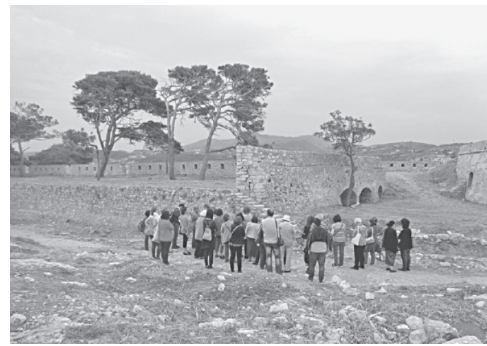
14 Μαΐου: Ξεναγήση στη Φορτέτζα από τις Ι. Στεριώτου και τη Ν. Καραμανλική.

Όμως, όπως ένας κούκος δεν φέρνει την άνοιξη, έτσι και μια μέρα παιχνιδιού στις συνολικά 365 δεν φτάνει για να γνωρίσουμε τον τόπο μας. Γι' αυτό και πολλοί απ' όσους ασχολούμαστε με το θέμα προσπαθούμε να σταθεροποιήσουμε και να διευρύνουμε το κοινό των φιλοσόφων με συγγραφές βιβλίων και άρθρων, με εισηγήσεις σε συνέδρια και ημερίδες, με ομιλίες, με προβολές, με ξεναγήσεις και με κάμποσους ακόμα τρόπους. Από αυτούς εξαιρετικά αποτελεσματικός έχει αποδειχτεί ο τελευταίος, των εκπαιδευτικών ξεναγήσεων-περιηγήσεων, στις οποίες το Ρέθυμνο αποδεικνύεται πρωτοποριακό. Αξίζει να αναφέρουμε εδώ ότι μέσα σε μόλις 23 μέρες, από τις 14 του περασμένου Μαΐου μέχρι τις 5 Ιουνίου, πραγματοποιήθηκαν σ' αυτό 13 συνολικά ξεναγήσεις, μερικές από τις οποίες επαναλαμβάνόμενες. Τις διοργάνωσαν δύο κυρίως φορείς, ο Σύλλογος Κατοίκων Παλιάς Πόλης και η Εφορεία Αρχαιοτήτων Ρεθύμνου: